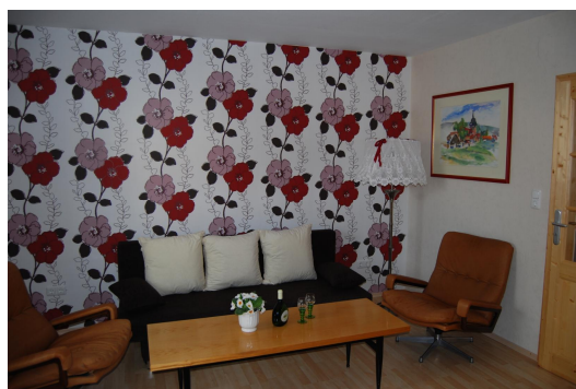
Wohnzimmer mit Schlafsofa

Die Ferienwohnung ist im Erdgeschoß. Der Eingang befindet sich an der Rückseite des Hauses. Die Wohnung verfügt über Wohnzimmer, Küche, Bad mit Dusche und zwei Schlafzimmer und bietet für bis zu sechs Personen gemütlich Platz.