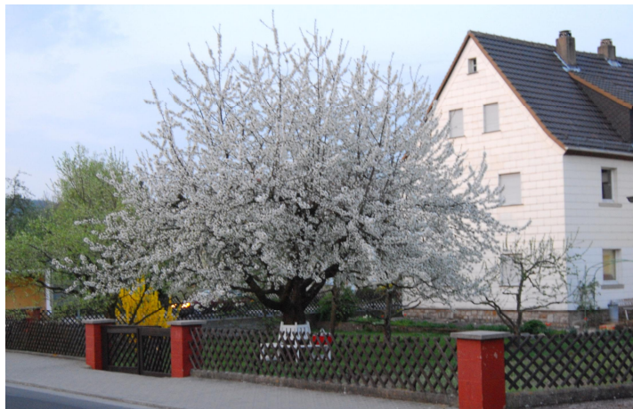
großer Garten und Terrasse am Haus

Die Ferienwohnung ist im Erdgeschoß. Der Eingang befindet sich an der Rückseite des Hauses. Die Wohnung verfügt über Wohnzimmer, Küche, Bad mit Dusche und zwei Schlafzimmer und bietet für bis zu sechs Personen gemütlich Platz.