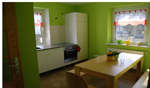
Küche mit Essecke